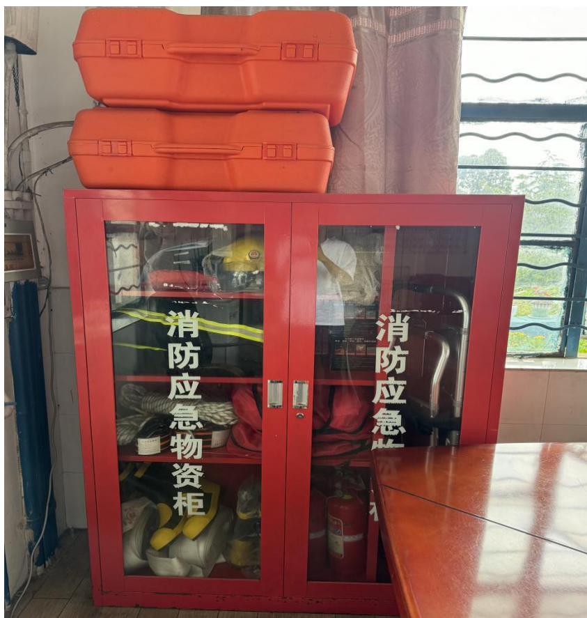
图 2-4 应急救援器材