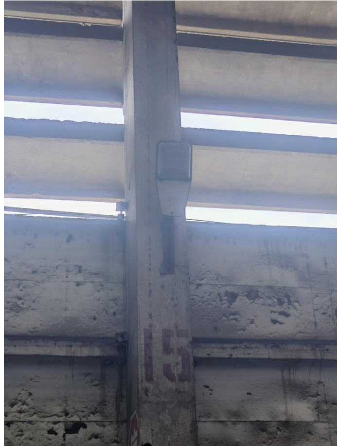
图 2-7 11 道侧照明设施