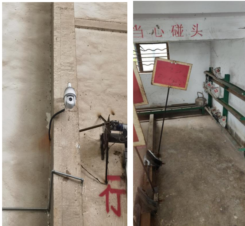
图 2-6 一号库监控探头及防溜铁鞋