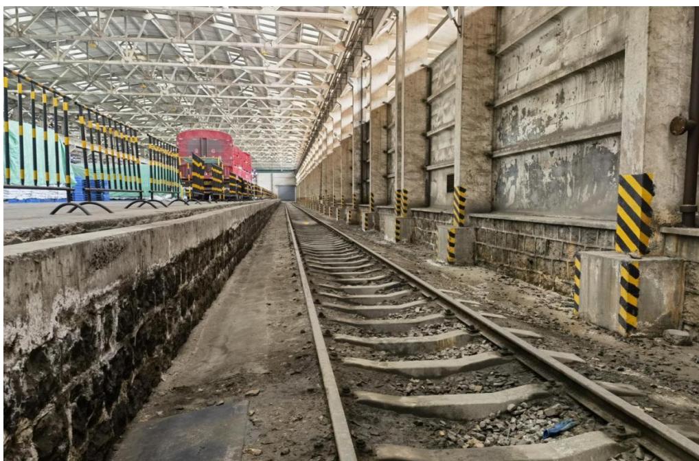
图 2-2 到达氢氧化钾（非罐装）卸车作业线（11 道）现场

氢氧化钾卸车仓库为钢混框架式结构，长 220m，宽 18m，高 12m，面积为 10800 m 2 。划分出单独存氢氧化钠的暂存货位，为 11 道左侧的 017 垮至 025 垮。采用人工装卸的方式接卸氢氧化钾和氢氧化钠。装卸站台高 1.2m。在该库区进大门右侧有喷淋、洗眼装置一套，中和池一个，氢氧化钾暂存货位上方设置有 4 只枪式监控探头，能对危险货物作业区域实现全覆盖，设有 150 瓦的防爆型照明灯。仓库内设置有室内消火栓、5kgMFZ/ABC 型灭火器。作业线现场及其周边环境见下图。