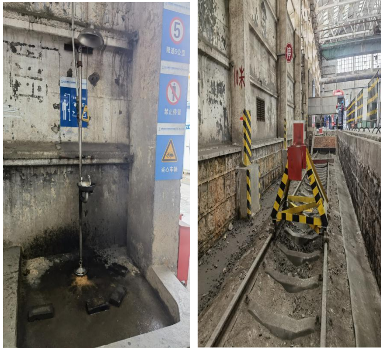
图 2-5 一号库洗眼器、11 道挡车器